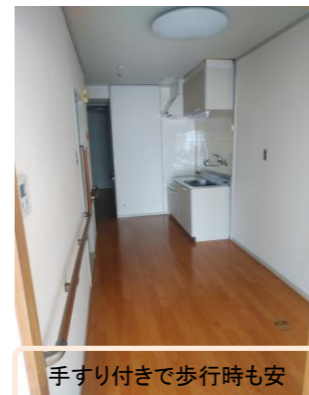
手すり付きで歩行時も安