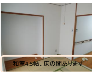
和室4.5帖、床の間あります