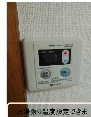
お湯張り温度設定できま