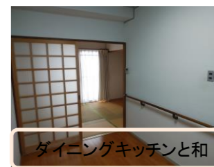
ダイニングキッチンと和