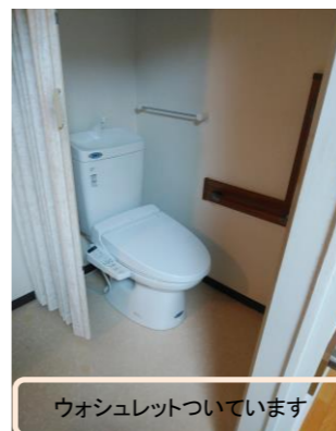
ウォシュレットついています