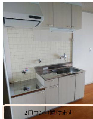
2口コンロ置けます

2022年4月現在45,000円で賃貸中 表面利回り約11.74% 実質利回り約6.72% 詳細はお問合せください