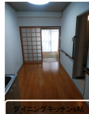
ダイニングキッチン6帖