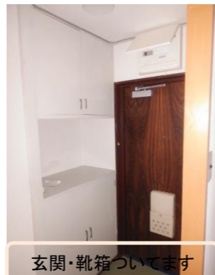
玄関・靴箱ついています