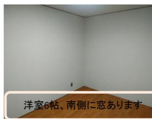
洋室6帖、南側に窓あります