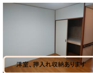
洋室、押入れ収納あります